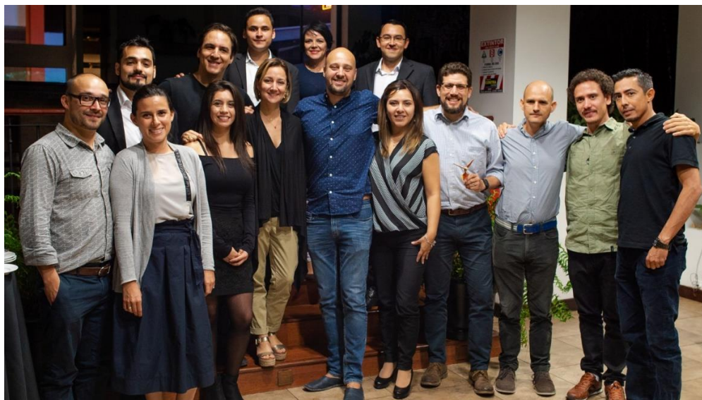
Estudiantes que realizaron su MCP en Rutas Naturbanas el día de su