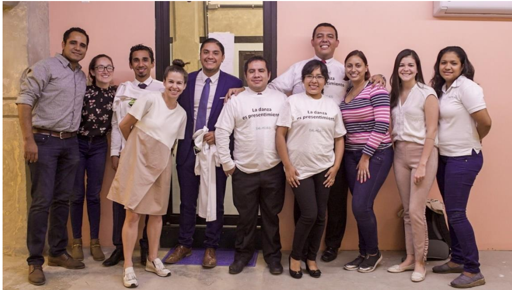
Estudiantes que realizó su MPC en la Fundación Espacio Creativo el día de su presentación final