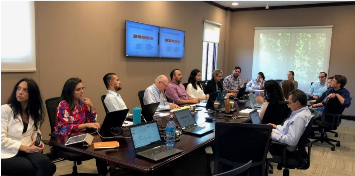
Participantes de la reunión de Cátedras y Centros de Impacto

y Centros de Impacto. Asistieron representantes de CLACDS, la Cátedra Steve Aronson, el Centro de Liderazgo Colaborativo de la Mujer, CAHI, el área de Sostenibilidad, CIMS, LACE y la Cátedra René Morales. Al final se establecieron las posibles áreas de colaboración entre las mismas.