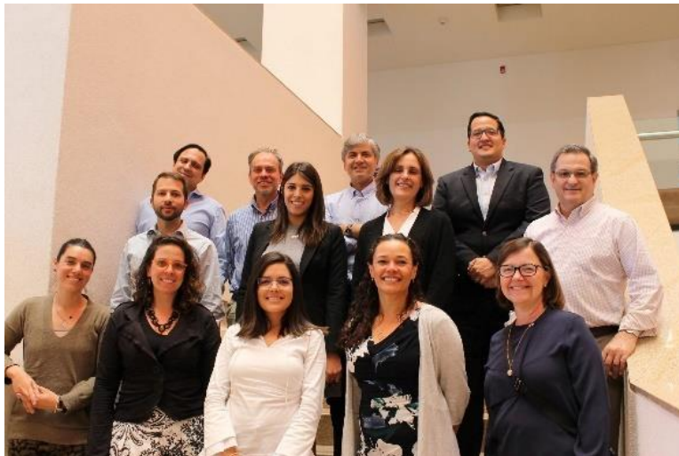
Participantes de la Reunión Anual de SEKN en el Tecnológico de Monterrey

Social Enterprise Knowledge Network (SEKN): En el mes de septiembre INCAE y la Cátedra Strachan, asumieron la coordinación de SEKN. Esta red está constituida por representantes de reconocidas escuelas de negocios de Iberoamérica como: EGADE Business School (México), ESPAE Graduate School of Management (Ecuador), ESADE Business School (España), Universidad de Sao Paulo FEA/USP (Brasil), IESA (Venezuela), INCAE (Costa Rica), Universidad Adolfo Ibáñez (Chile), Universidad de los Andes (Colombia), Universidad del Pacífico (Perú) y Universidad de San Andrés (Argentina). SEKN busca generar y difundir información para convertirse en un líder del conocimiento en iniciativas empresariales y sociales, inclusivas y sostenibles.